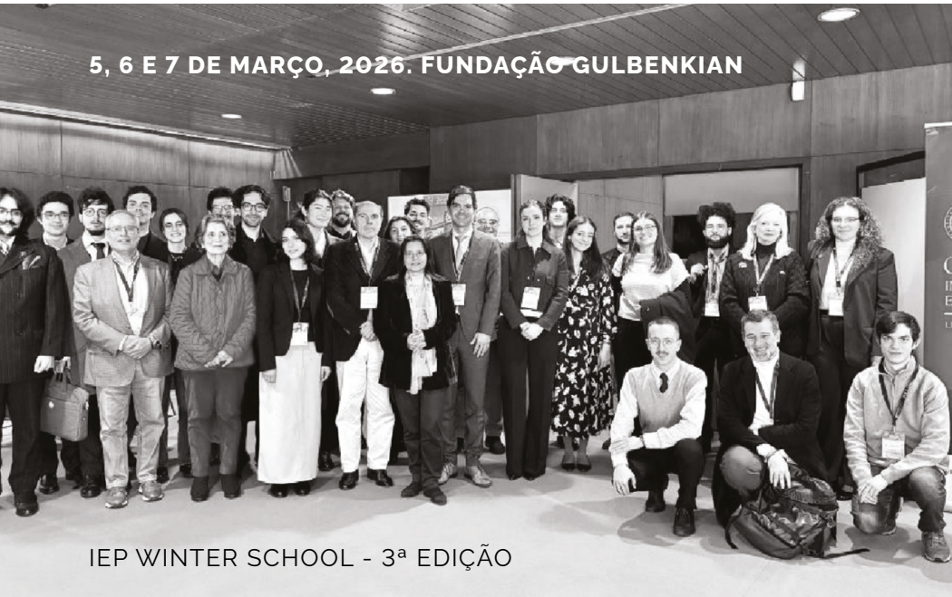
IEP WINTER SCHOOL - 3ª EDIÇÃO

5, 6 E 7 DE MARÇO, 2026. FUNDAÇÃO GULBENKIAN