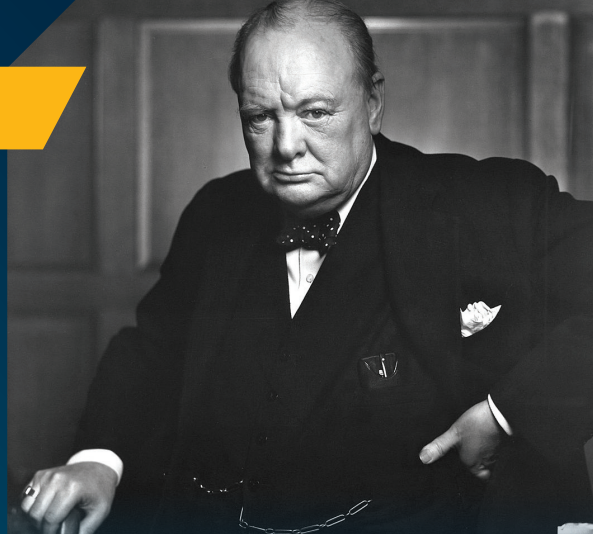
SIR WINSTON CHURCHILL