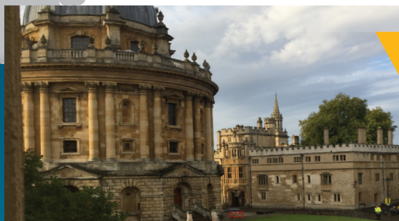
UNIVERSIDADE DE OXFORD PROGRAMA DE 1 TRIMESTRE