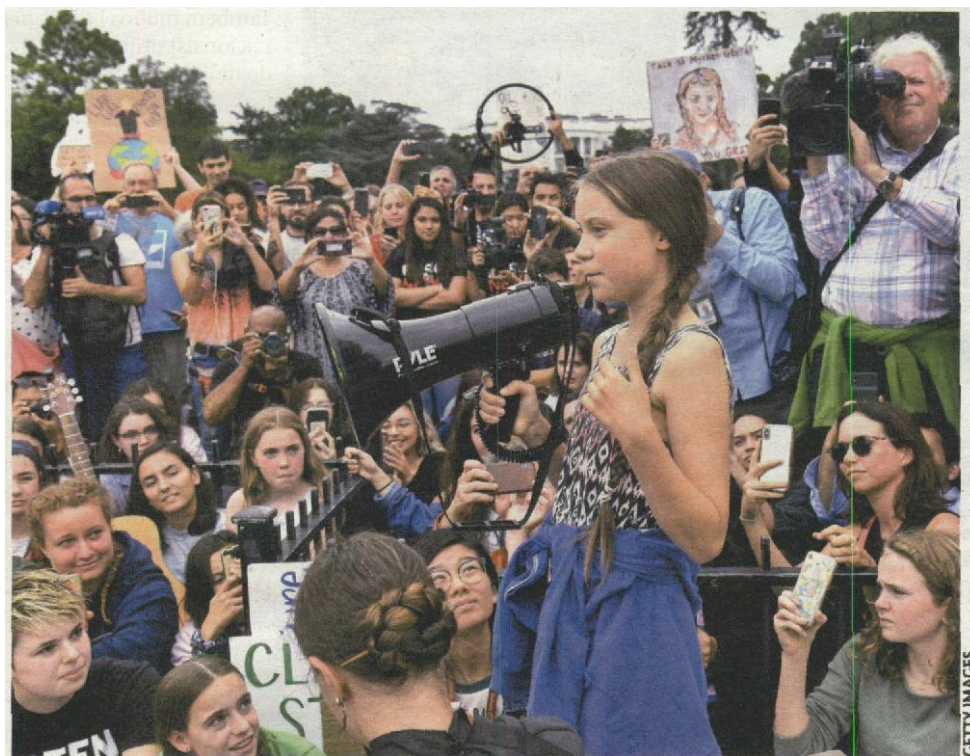
Greta Thunberg "Tem denunciado com rigorosa candura a diferença entre as palavras e os atos de governos e grandes empresas"

Bem sei que é imensa e variegada a constelação de excluídos (trabalhadores assalariados tornados obsoletos pela inovação tecnológica ou pela deslocalização empresarial, mulheres, comunidades rurais, povos indígenas, entre muitos outros), contudo, surpreendo-me sempre quando reparo que o carácter potencialmente explosivo da exclusão de gerações futuras, na sua quase integralidade, não é devidamente contemplado como enorme ameaça à paz e coesão das sociedades.